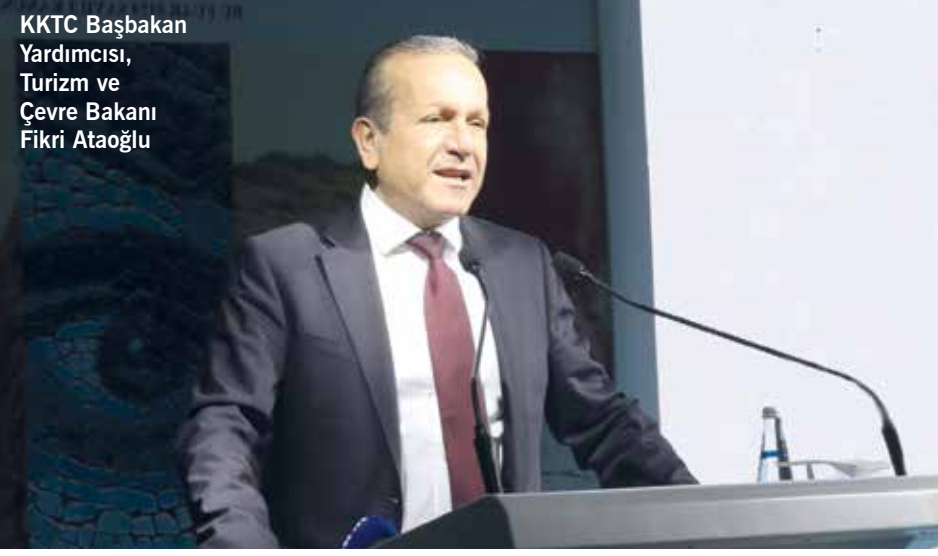
KKTC Başbakan Yardımcısı, Turizm ve Çevre Bakanı Fikri Ataoğlu

Kuzey Kıbrıs Türk Cumhuriyeti Başbakan Yardımcısı, Turizm ve Çevre Bakanı Fikri Ataoğlu konuşmasında Diyarbakır ile KKTC'nin yakınlığına dikkat çekti.