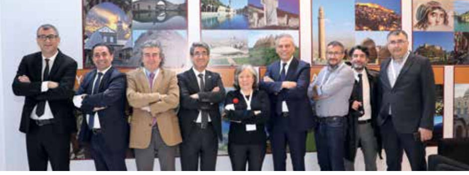
1. Mezopotamya Turizm ve Gastronomi Fuarı basın mensupları tarafından yoğun ilgi gördü

Ayrıca bu heyecanımıza ortak olan partner ülkemiz Kuzey Kıbrıs Türk Cumhuriyeti'ne, partner iller Erbil ve Bursa'ya şükranlarımızı sunuyoruz. Mezopotamya coğrafyasında bulunan kentlerimiz ve bu kentlerdeki insanlarımız için turizmin önemini hepimiz biliyoruz. Turizm refahın, kültürlerin paylaşımı ve toplumların birbirini tanıma ve anlamasının en etkili yoludur. Turizm ve kültür ilişkisinin en güçlü şekilde ortaya çıktığı bu coğrafyada turizme inanmak, sarılmak değerli ve alkışlanası bir çabadır. Bu fuar, bu bilginin, anlayışın, inancın ve çabanın eseridir. 12 bin yıllık geçmişle insanlık tarihi açısından benzersiz izler taşıyan Mezopotamya'nın destansı toprakları tarihi ve kültürel zenginliklerinin yanı sıra insanı, mutfağı, el sanatları, misafirperverliği ile turistin yeni beklentilerinin hepsine cevap verebilen çok özel bir destinasyondur. Bölge kültür, inanç ve gastronomi turizminin en önemli duraklarından biri konumunda. Bizler, geçmişin izlerini, gelenek ve göreneklerini hem coğrafyanın hem de insanların güzelliklerini tüm dünyaya tanıtabilmek için çalışmalarımızı sürdüreceğiz. Bu fuar, bu açıdan büyük bir zemin ve yepyeni bir başlangıç olacaktır.