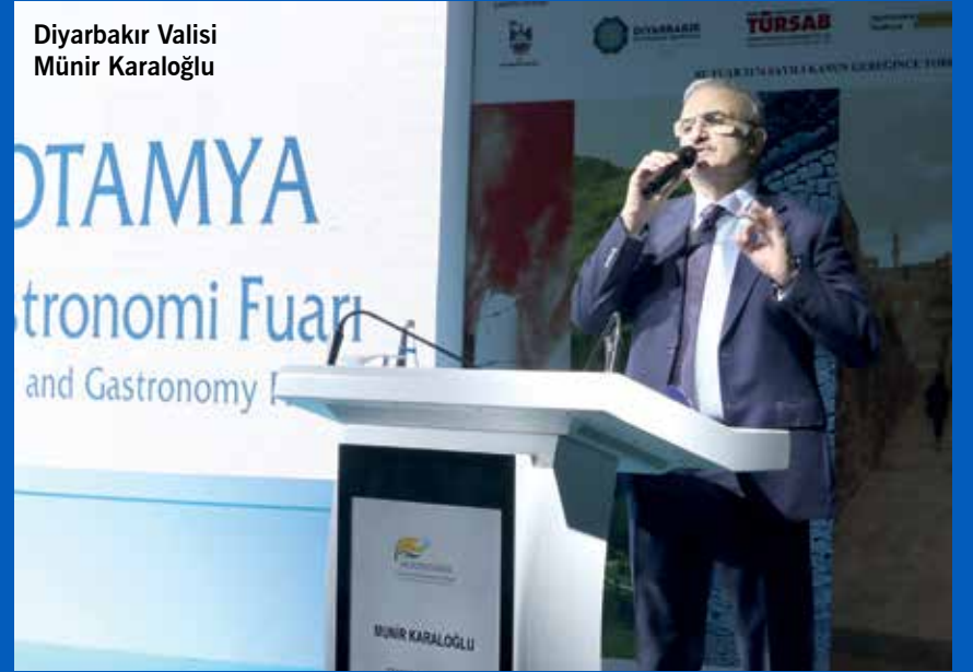
Diyarbakır Valisi Münir Karaloğlu

Diyarbakır Valisi Münir Karaloğlu konuşmasında bölgenin zengin kültürel miraslarının bir bütün halinde tanıtılması gerektiğine dikkat çekti.