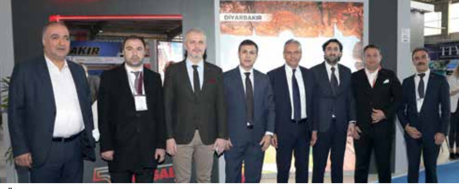
TÜR SAB Bölge Temsil Kurulu Başkanları Türkiye'nin dört bir köşesinden fuara katılım sağladı