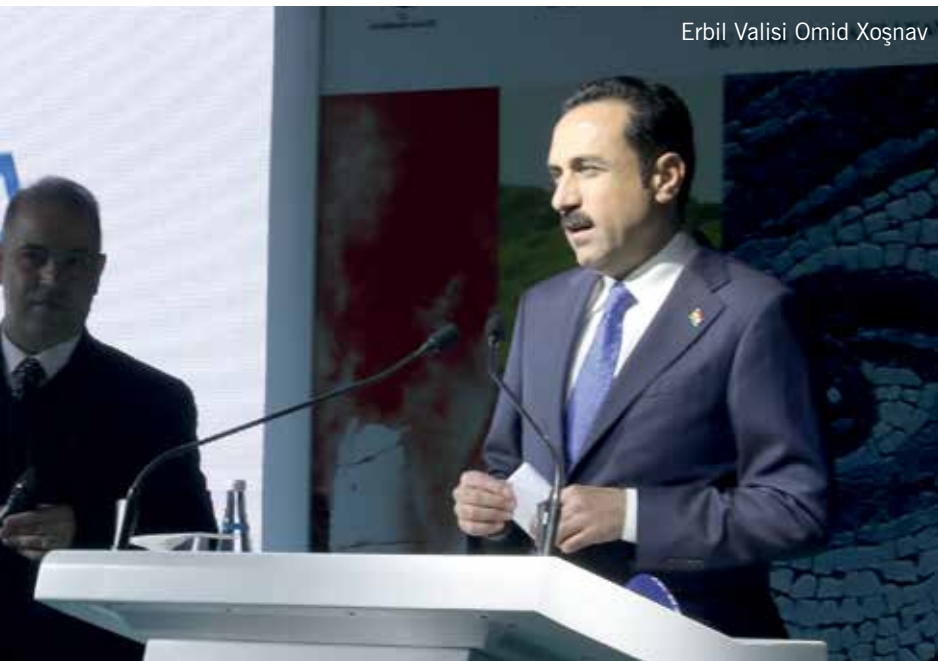
Erbil Valisi Omid Xoşnav

Fuarın partner şehirlerinden biri olan Erbil'in Valisi Omid Xoşnav, fuardan duyduğu memnuniyeti şu cümlelerle ifade etti: "Burada olmaktan dolayı çok mutluyuz. Kabinemizin amaçları arasında turizm çok önemli bir noktadır. Irak ve bölgemiz arasında ilişkilerin daha kuvvetli olmasını istiyoruz. Davetinizden dolayı çok mutlu olduk. Sizi desteklemeye hazır olduğumuzu ifade etmek istiyorum. 4 Nisan'da Erbil'de bir fuarımız olacak. Sizleri davet etmekten şeref duyarız. Erbil şehri büyük bir kapıdır. Yüzlerce şirket bölgemizde faaliyet gösteriyor. Bu şirketlerin büyük bir kısmı Türk şirketi. Bu vesileyle yatırımcıları ve iş adamlarını Erbil'e davet ediyoruz. Parlamentomuzun çerçevesinde her hizmeti sunmak üzere söz veriyoruz."